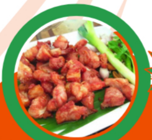
แขนกระดูกอ่อน