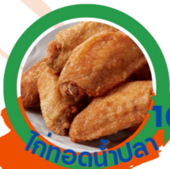
ไก่ทอดน้ำปลา