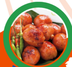
ไลครอกอีสาน