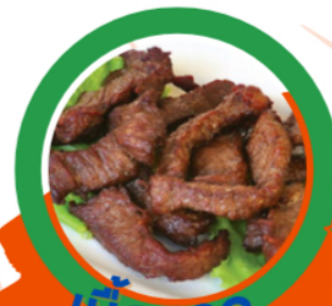
เนื้อแดด