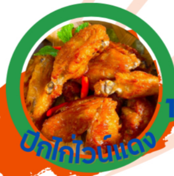
ปีกไก่จิ้มแจ่ว