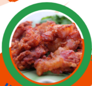
แขนสามชั้น